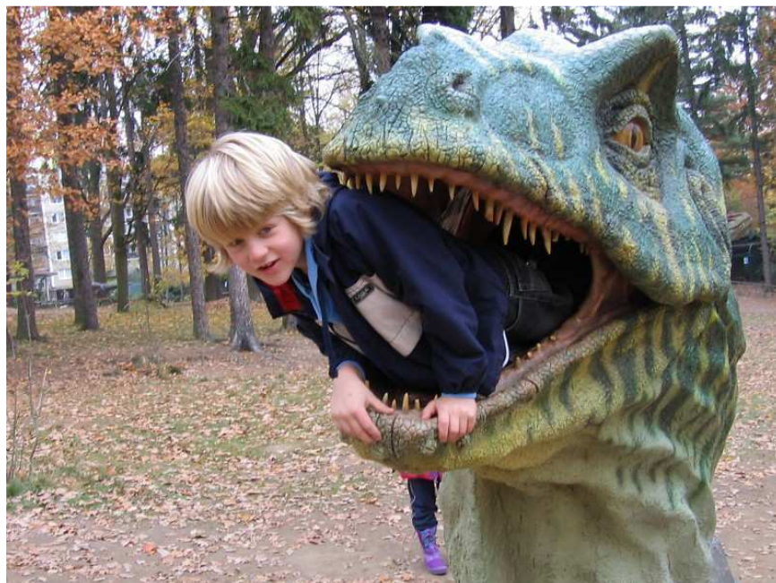
Z exkurze se opravdu všichni vrátili.

Každý rok se školní sbor připravuje na svá vánoční vystoupení na krátkém soustředění. I letos jsme snily pod školní střechou. Všechny zpěvačky velkého i malého vzrůstu shromáždily své přeplněné tašky v družině. Nedalo se projít bez zaškobrtnutí. Pak následovalo vynášení židlí, stolů, stolečků a židliček. Po úpravě spinkacích míst jsme šly protáhnout hlasivky s paní učitelkou Honzovou. Koncert se blíží a na skřehotání není nikdo zvědavý. Po práci hraní, pak zas zpívání, kreslení a večere, až nastal čas oblíbeného bobříka odvahy. Letos se jmenoval Po