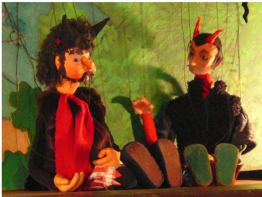
Kdo nezlobí, nemusí se bát.