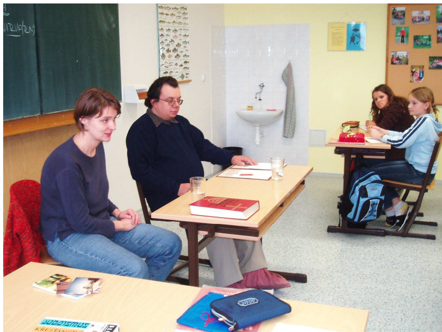
Vzácná návštěva přivedla k smíchu i zamyšlení.

Poté začne čtyřem „dobrovolníkům“ klást otázky. Všichni se prozatím drží, všechny odpovědi jsou správné. Na program je píseň.