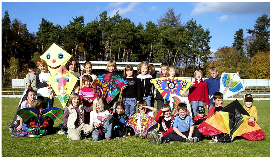
Draci a dračice ☉ foto Irena Bětíková