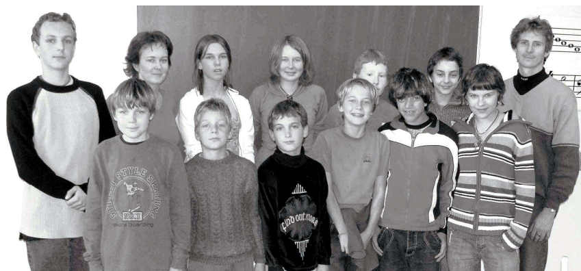
Malá školská rada v novém složení