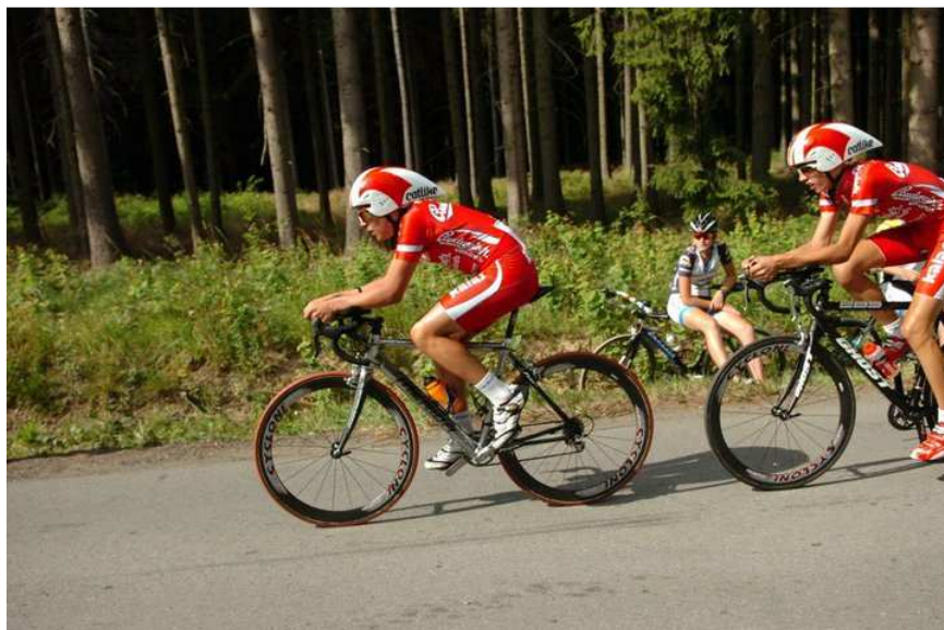
Kluci v akci

Kopce mám rád, protože jsem v nich rychlý a snažím se útočit ve