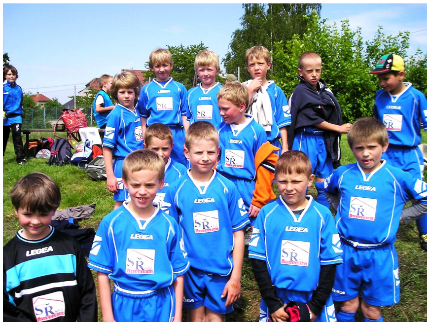
Squadra Azura