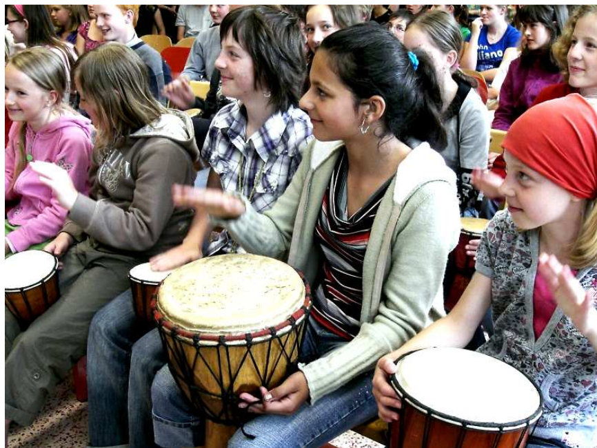
Ta písnička se jmenovala Radost.