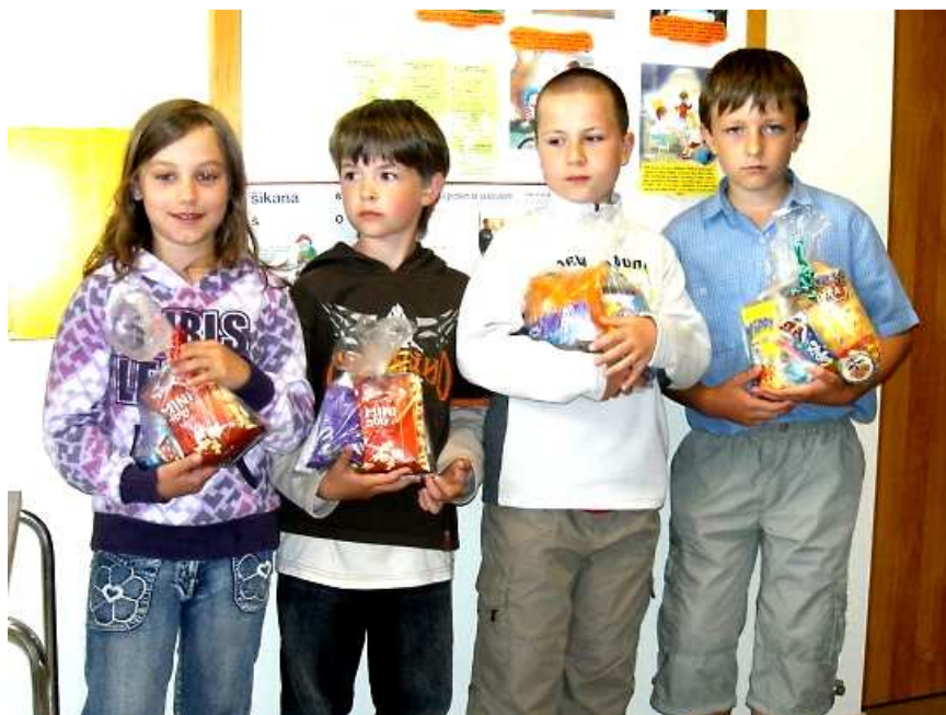
Potěšili jste nás, píšeme jedna.

jsme vyrazit. Chodili jsme po skupinkách rozdělených podle věku do tří kategorií. Procházeli jsme jednotlivými stanovišti a plnili různé úkoly týkající se jak jinak než přírody. Některé úkoly byly opravdu těžké. Jiné jsme měli bez chyby. I když jsme získali celkově dost bodů, na umístění mezi prvními třemi družstvy to nestačilo. Vždy to uteklo jen o pár bodů, skončili jsme totiž ve většině případů čtvrtí nebo šestí. Sice jsme se neumístili na pozicích nejlepších, ale nevdáváme. Jsme rádi za to, že jsme se mohli zúčastnit, a také za to, že jsme našli do příští soutěže spoustu zkušeností. Tak do příštího roku hodně štěstí a hlavně spoustu nových vědomostí!