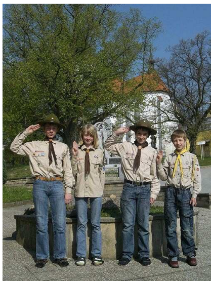
Naši skauti ☉ foto Jiří Honza