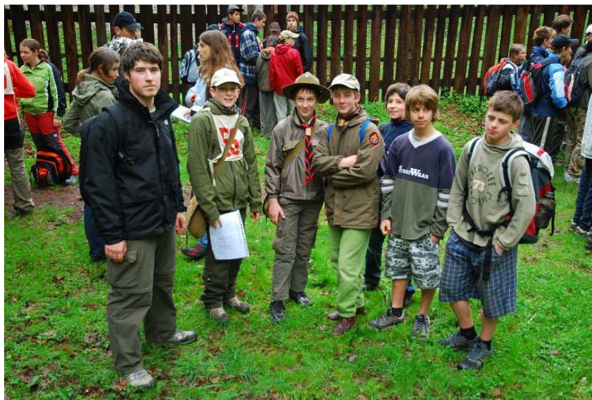
Svojsíkův závod ☉ http://sirokko.junak-tabor.com/novy_web/phprs/