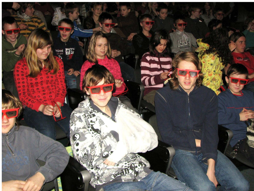
Ponoření v hmotě