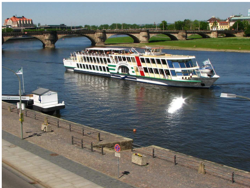
Kapitáne, kam s tou lodí?