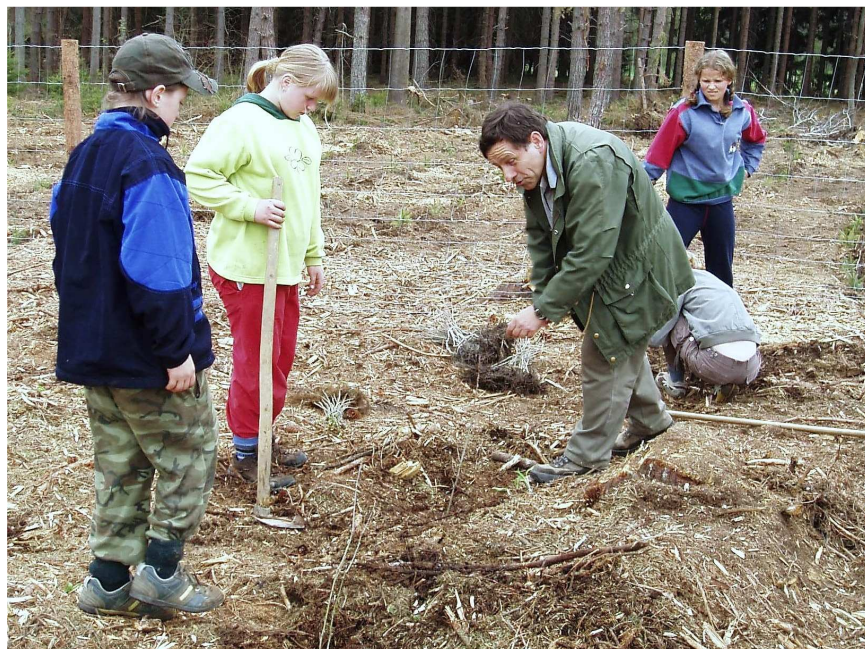
Hajný je lesa pán ☺