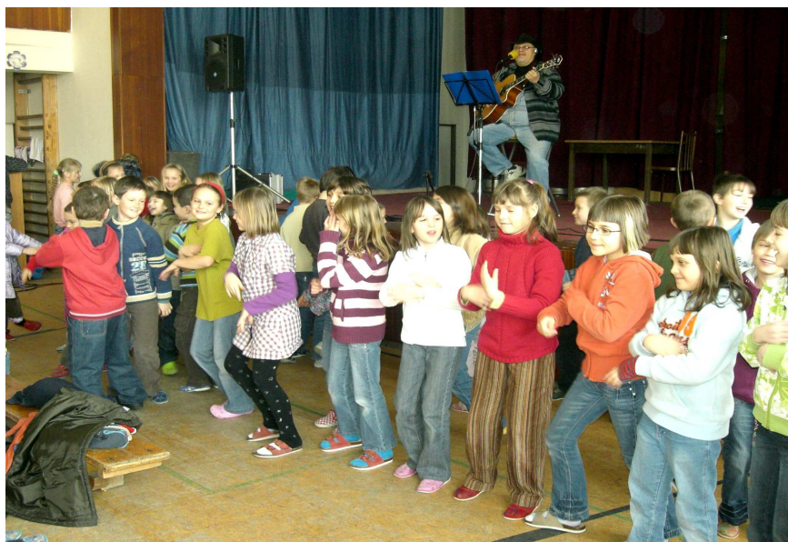
Všichni jsme superstar ☺