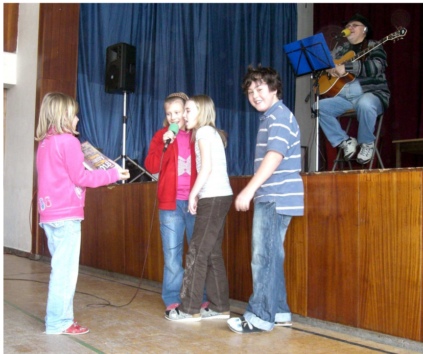
Byla to legrace ☺

Všichni tři prošli dlouhou cestou pěti kol, v nichž ukazovali, co v nich je, a často si vyslechli přísné