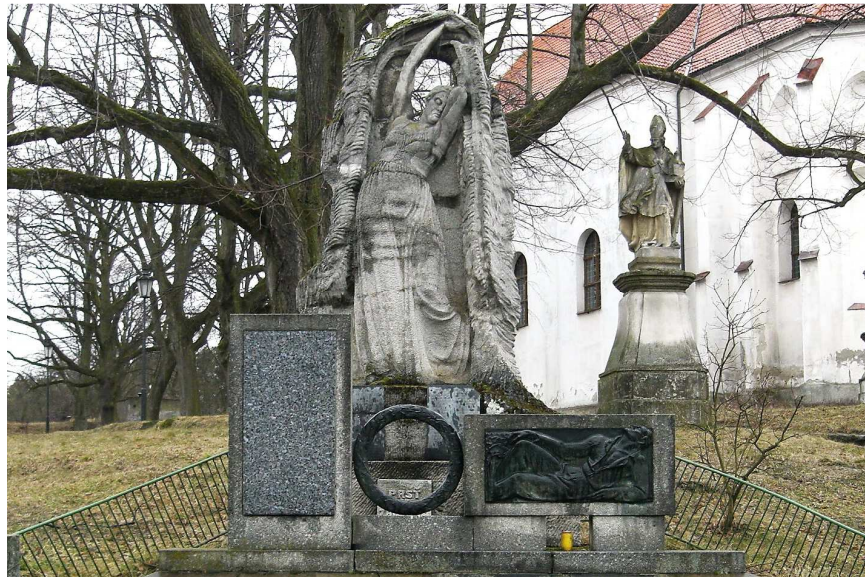
památník obětem obou světových válek

Nacismus byl nejvíce rozrostlý za druhé světové války, ale i dnes se najdou převážně mladí lidé, kteří nacismus uznávají a propagují. Proč to dělají? Já si myslím, že to jsou lidé, kteří nevěří sami v sebe, ve své schopnosti a dovednosti. Snaží se prosadit pomocí násilí. Co je hezkého nebo správného na tom, když někdo někoho zbije a donutí ho dělat věci, které by jinak nikdy nedělal? Hezkého a správného na tom není nic. Lidé, kteří dnes propagují nacismus, v naprosté většině neprožili druhou světovou válku a nedokáží si uvědomit hrůzy, které by zažili, kdyby v té pohnuté době žili. Ani já jsem tehdy nežila, ale můžete si být jisti, že jsem ráda za to, že dnes žijeme v míru. O válce jsem něco slyšela a přečetla jsem si knihu Říkali mi Leni, která je ukázkou života za druhé světové války. Árijci měli být nadřazení všem ostatním. Kvůli tomu se vypalovaly vesnice, vraždili nevinní lidé, a to všechno jen proto, že si někdo chtěl dokázat, že je lepší než ti