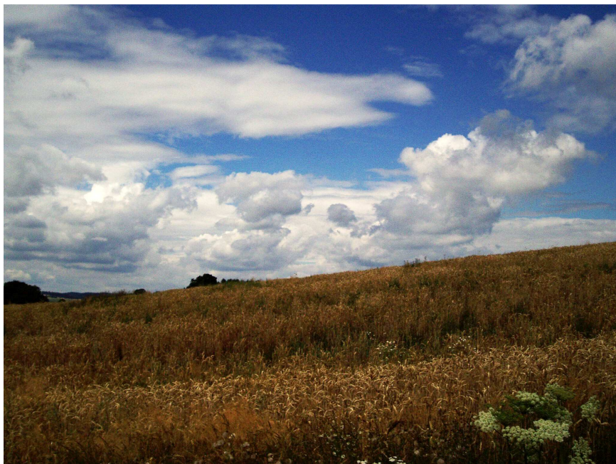
Pegas nad letištěm