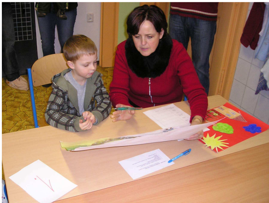
Chvilka soustředění ☹ foto archiv školy