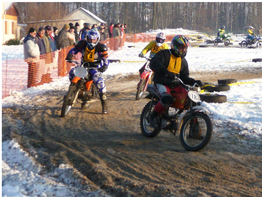
I slabý může buráčet

A už je tu konec a fichtlaři sesedají ze strojů celí ztuhlí. Po vyhlášení výsledků už si každý zalezl do tepla, aby se napil a dostal něco teplého k snědku.