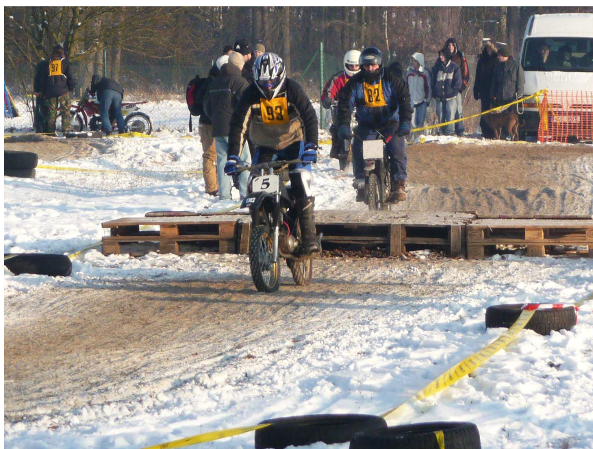
Překážek se nelekejme, na množství nehleďme ☞ foto Aneta Boušková