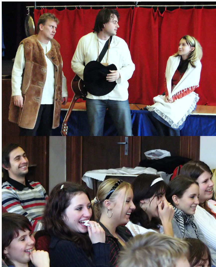
Dejte mi ji za ženu