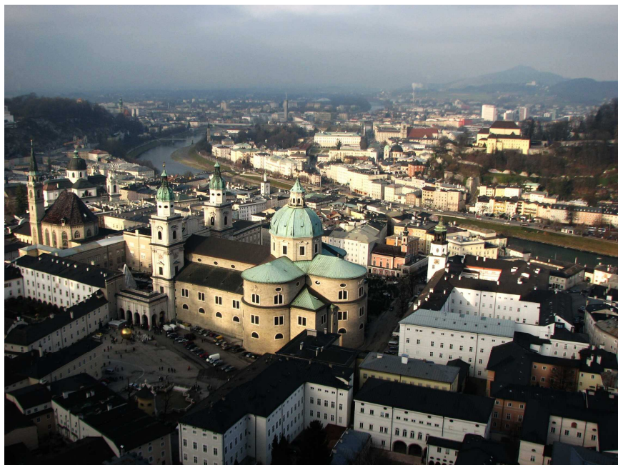
Shöner Salzburg

Hned, jak děti dohrály a dozpívaly, nastoupil pěvecký sbor. Zazpíval známé koledy a vánoční písně. Nechyběly ani