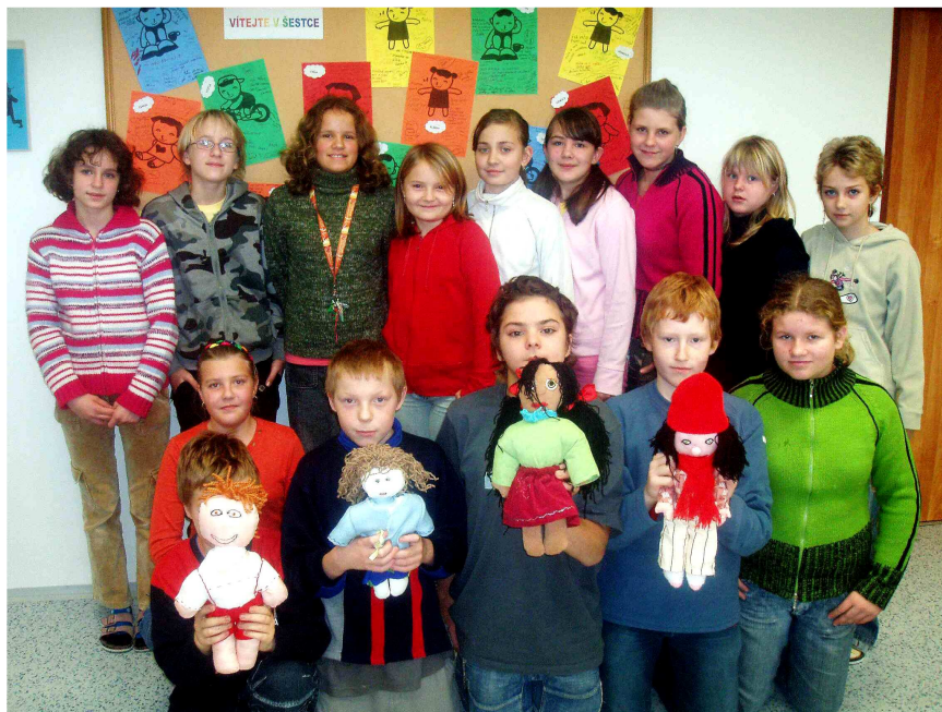
šestáci a jejich panenky

„Když si pomyslím, že každou chvíli umírají na světě děti a já a moji spolužáci tento počet můžeme snížit, je to krásné. Dělal jsem panenku s radostí, protože jsem mohla zachránit dítě a pomoci mu od jisté a hrozné smrti. Určitě mi nevádí, že mám prsty od šití celé popíchané. Víím, že je to divné, ale připadám si jako bůh, který nadělil život. Je to krásný pocit vědět, že někdo díky