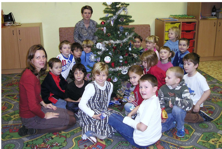
první Vánoce ve škole ☺