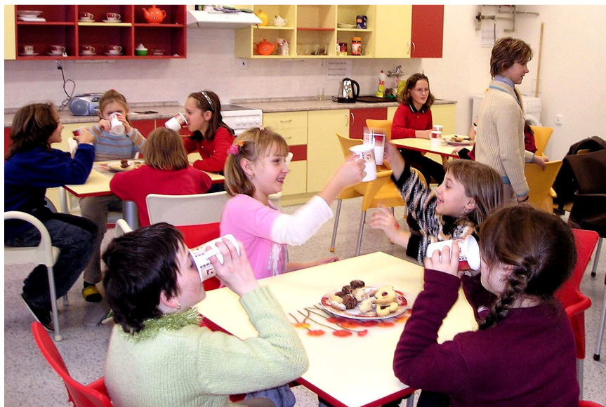
zasloužená předvánoční hostina ☛ foto Martin Viktora

Píšťalka zahrála skvěle, je to slyšet na potlesku. Teď je řada na nás. Tak, příchod na pódium jsme zvládli. A teď koledy. Jedna, druhá, nervozita pomalu opadá. Máme to za sebou. Následuje malá přestávka. Co to? Že by Santa Claus? Ano, je to on. A těch dárků. Po počátečním ostychu se