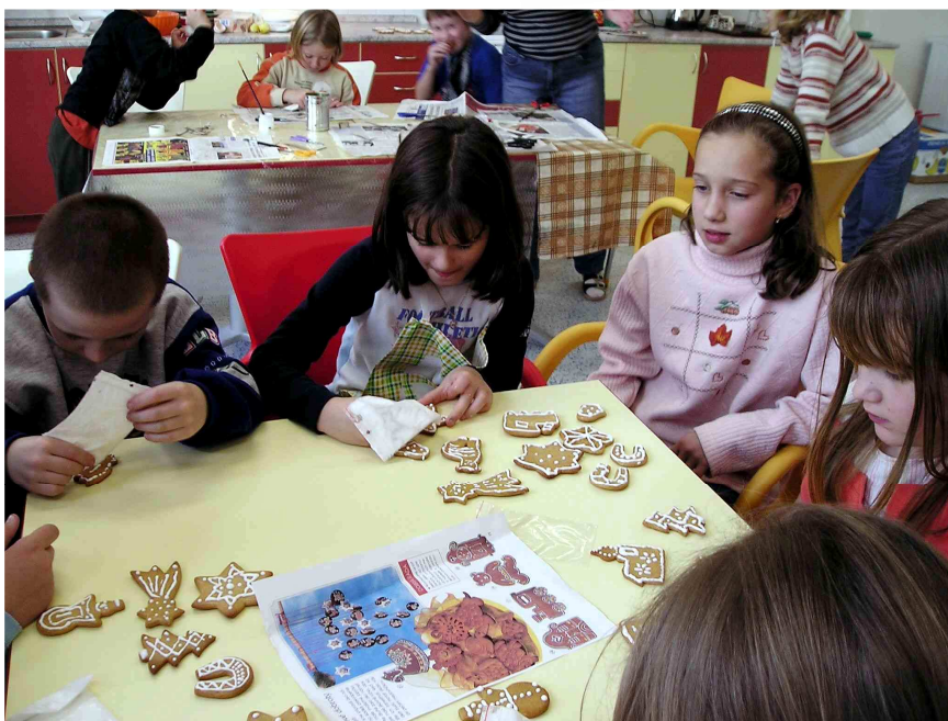
zdobení perníčků ☛ foto Miluše Fürbachová